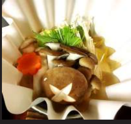
きのこの柚子塩鍋

※(お鍋は / 海鮮鍋 / きのこの柚子塩鍋 / 豚味噌鍋の中から1つお選び下さい。)