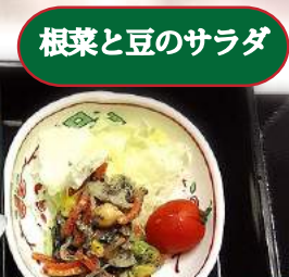
根菜と豆のサラダ