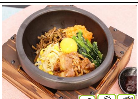
石焼ビビンバカルビ 850円