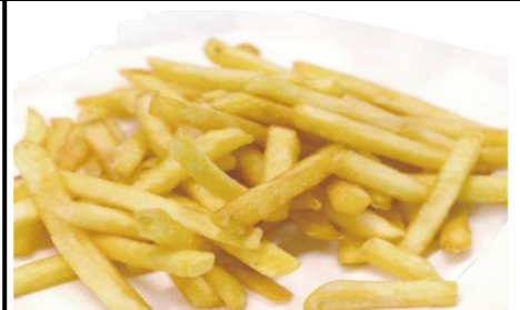
フライドポテト 230円