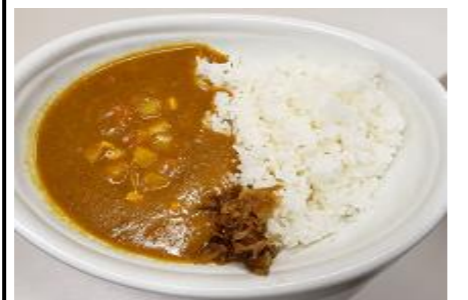
お子様カレーライス 580円