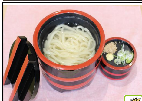
釜揚げ讃岐うどん 590円