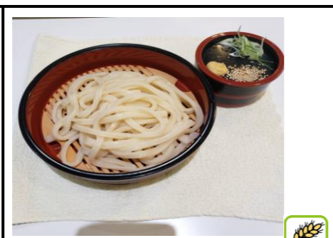
冷やし讃岐うどん 590円