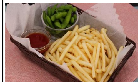
ポテト3倍・枝豆付 メガポテ 680円