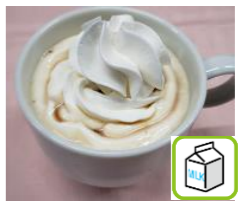
ウイナーコーヒー