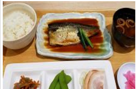
数量限定 なくなり次第終了 お魚定食 680円