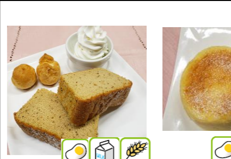
シフォンケーキ 540円