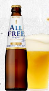
《ノンアルコールビールテイスト飲料》 オールフリー 〈小瓶〉