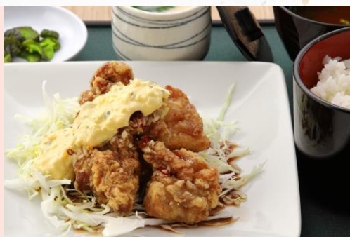
チキン南蛮定食 1,480円 (単品 1,080円)