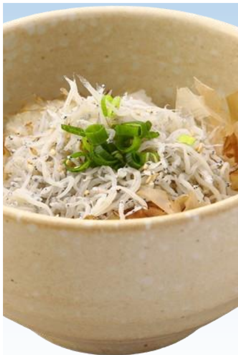
ミニしらす井セット 850円