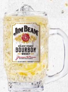
ジムビーム ハイボール