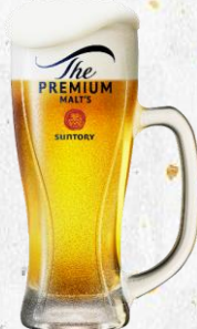
ザ・プレミアム・モルツ 生中1杯