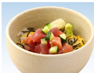
ミニばらちらしセット 850円