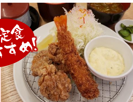
えび・からコンビ定食 1,580円