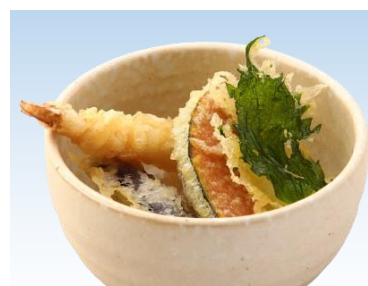
ミニ天井セット 950円