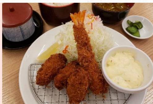
えび・カキフライコンビ定食 1,580円