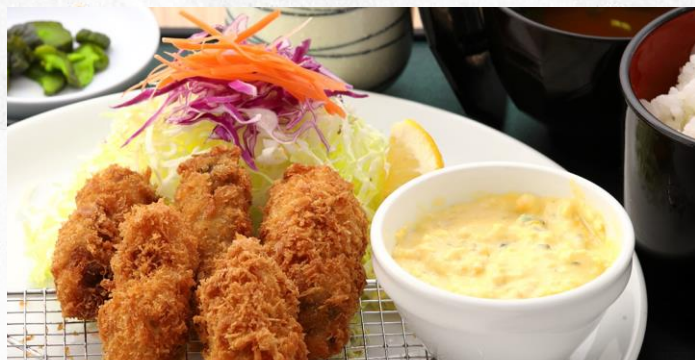
カキフライ定食 1,380円 (単品 980円)