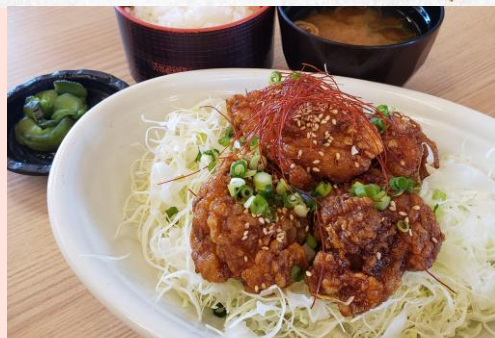
ヤンニョムチキン定食 1,480円 (単品 1,080円)