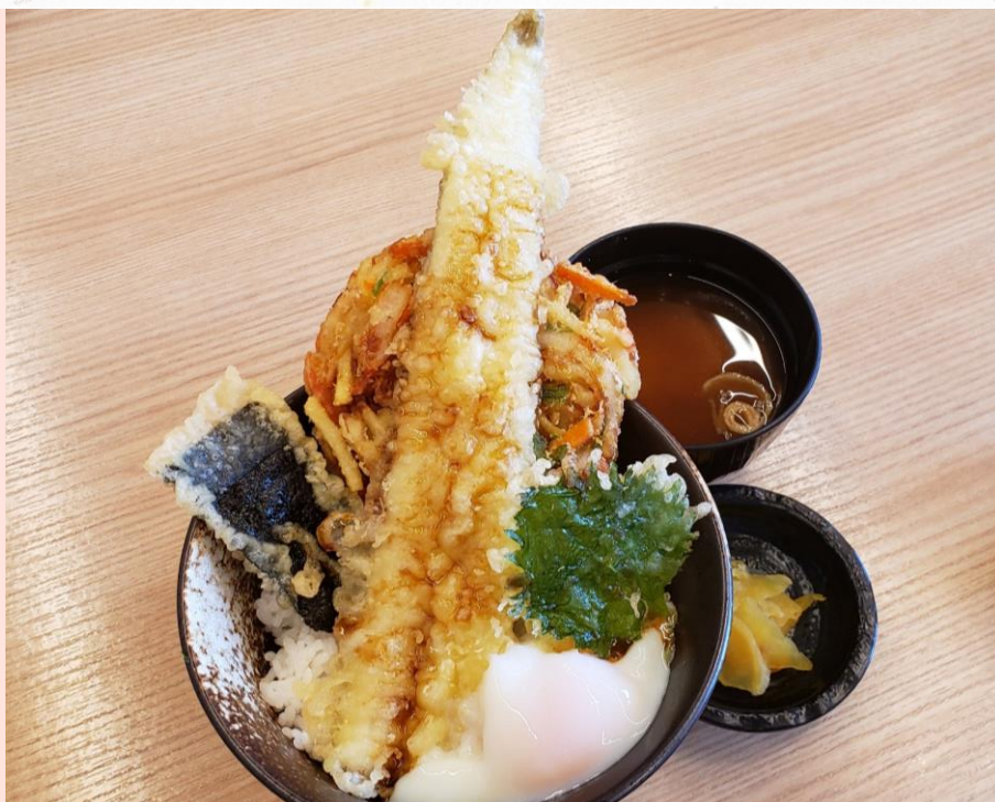
ハイウェイオアシス丼