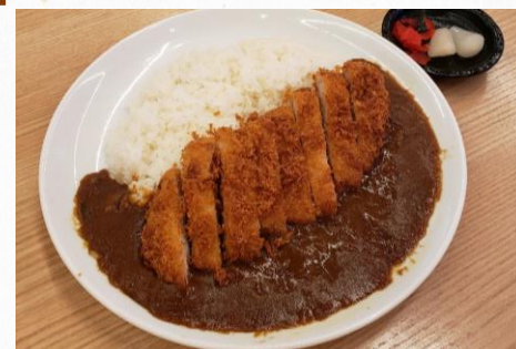
カツカレーライス