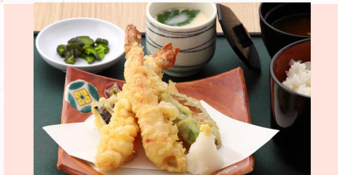
エビ天2本と野菜の天ぷら盛り定食 1,580円