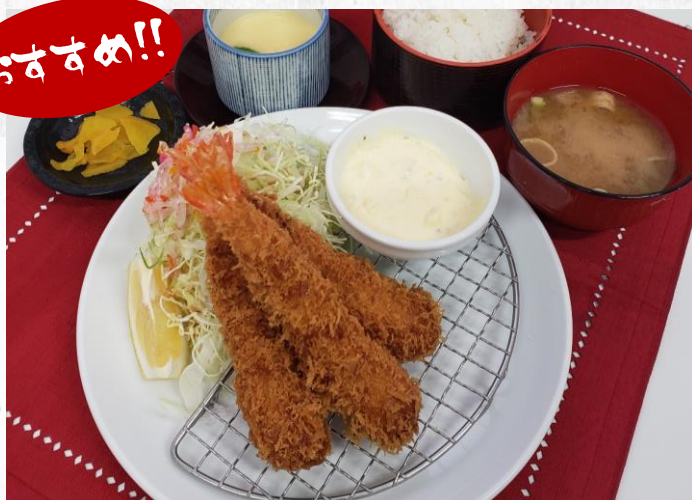
エビフライ定食 (手仕込み) 1,680円 (単品 1,280円)