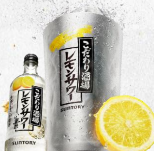
サワー各種 (レモン・タコハイ・しょっぱい梅)