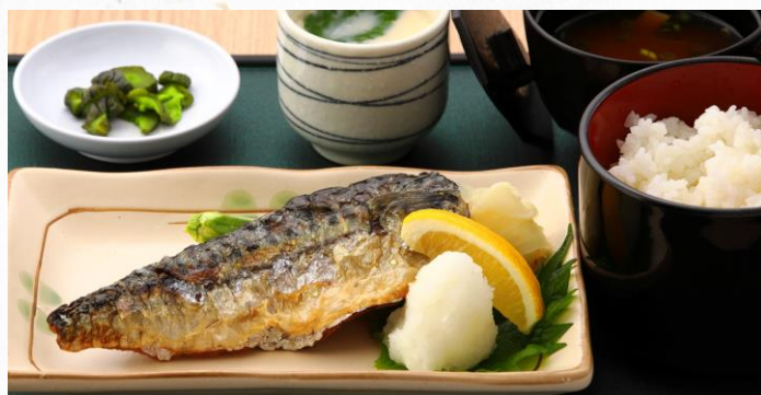
本日のお魚定食(小鉢付) 1,480円