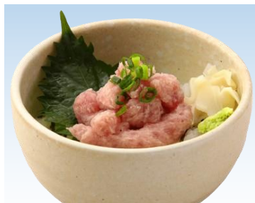
ミニねぎトロ井セット 850円