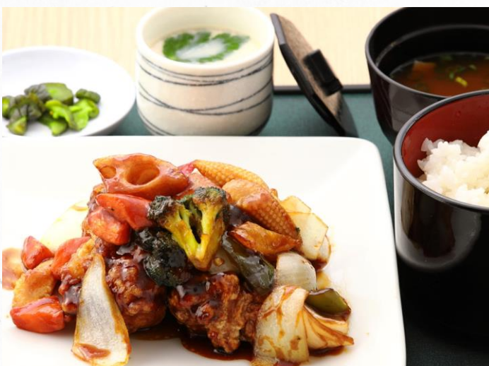
グログロ野菜と 鳥もも肉の黒酢あんかけ定食 1,580円