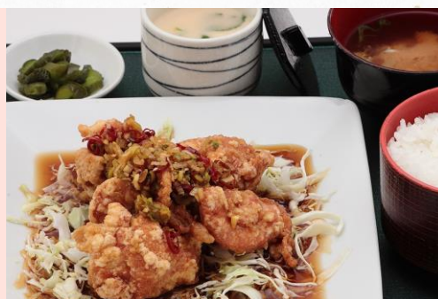
油淋鶏定食 1,480円 (単品 1,080円)