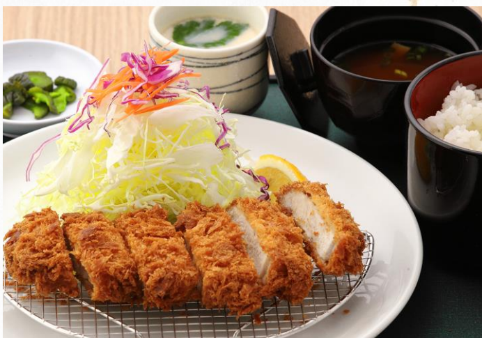
トンカツ定食 1,480円 (単品 1,080円)