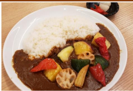
野菜たっぷりカレーライス