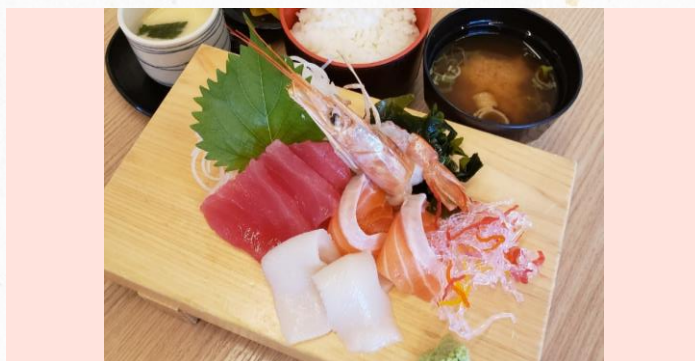
ザ・お刺身定食 1,580円